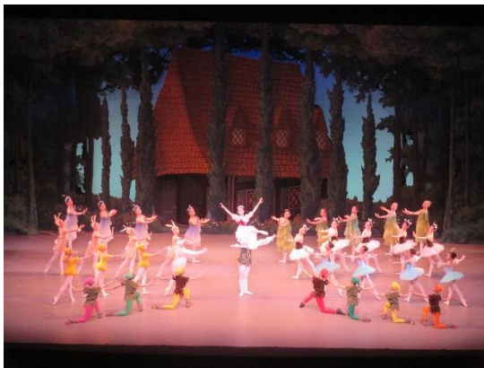
ジュニアバレエ発表会

オーケストラについては、新たな取り組みとして新潟でのジュニアオーケストラフェスティバルへの参加や、団内アンサンブル大会&交流会などを実施し、充実した1年だった。