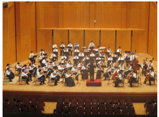
ジュニアオーケストラ定期演奏会