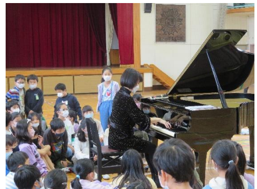
ピアノ・アウトリーチ

【事業番号1】アウトリーチ・コンサート…助成金の採択を受け、従来のプログラムに加えた追加プログラムを実施することができた。講師は、江東区にゆかりのある演奏家、共催公演等で関係性を構築したアーティストの中から、アウトリーチコンサートのノウハウを持った演奏家に依頼し、大変好評を得たところである。